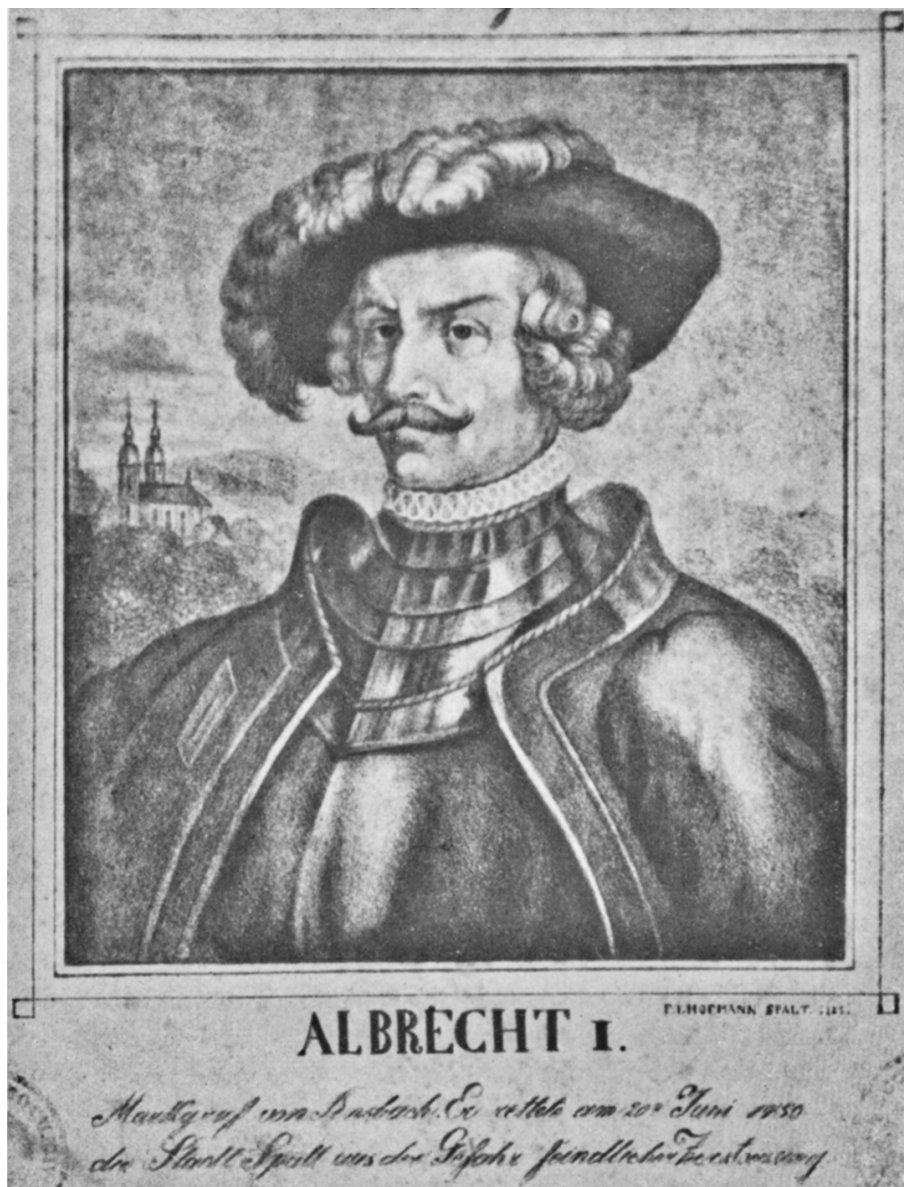
Abbildung 3: Albrecht Achilles von Brandenburg (1414-1486)

Albrecht war ein vorbildlicher und kluger Landesherr, ein gewinnender Fürst mit Aufgeschlossenheit für Jagd, Spiel und Tanz und ein ausgezeichnete Heerführer und Ritter. Er war ein unverwüstlicher Draufgänger, ein unschlagbarer Lanzenstecher seiner Zeit, ein Haudegen, der beständig im Sattel saß, während seine »Leythunde«, die Räte, den diplomatischen Krieg gut führten. Trotz mancher Misserfolge und Rückschläge ließ er sich nicht »aus den Schuhen bringen«. In seiner Umgebung tröstete man sich: »Weggelaufene Weiber und abgewonnene Schlösser kehren immer wieder.«