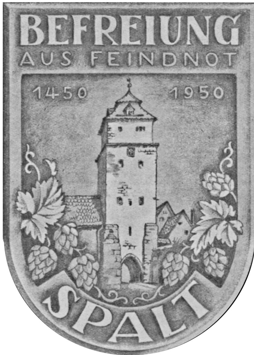
Abbildung 1: Befreiung aus Feindnot